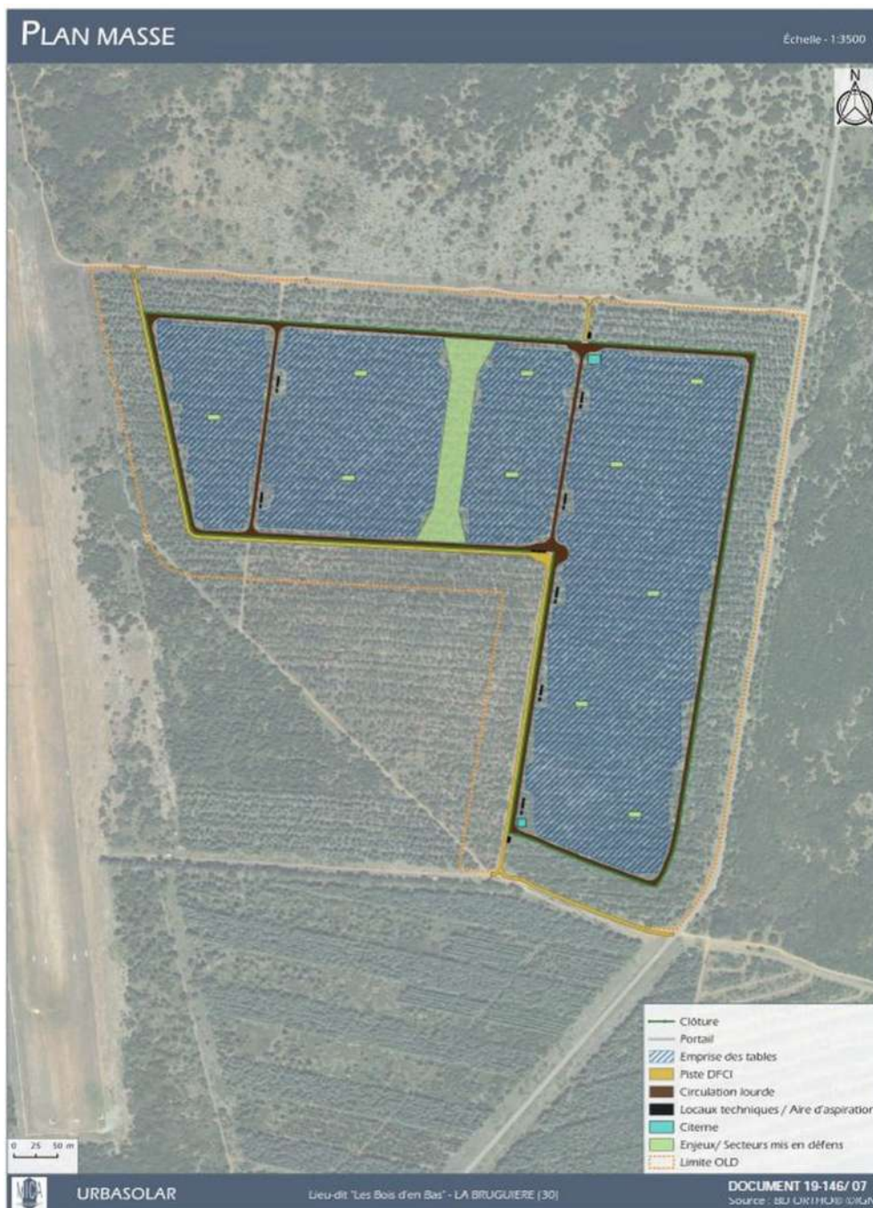
Figure 2: Plan de masse

La durée des travaux est évaluée à environ 10 mois. La phase de chantier s'organise selon les étapes suivantes :